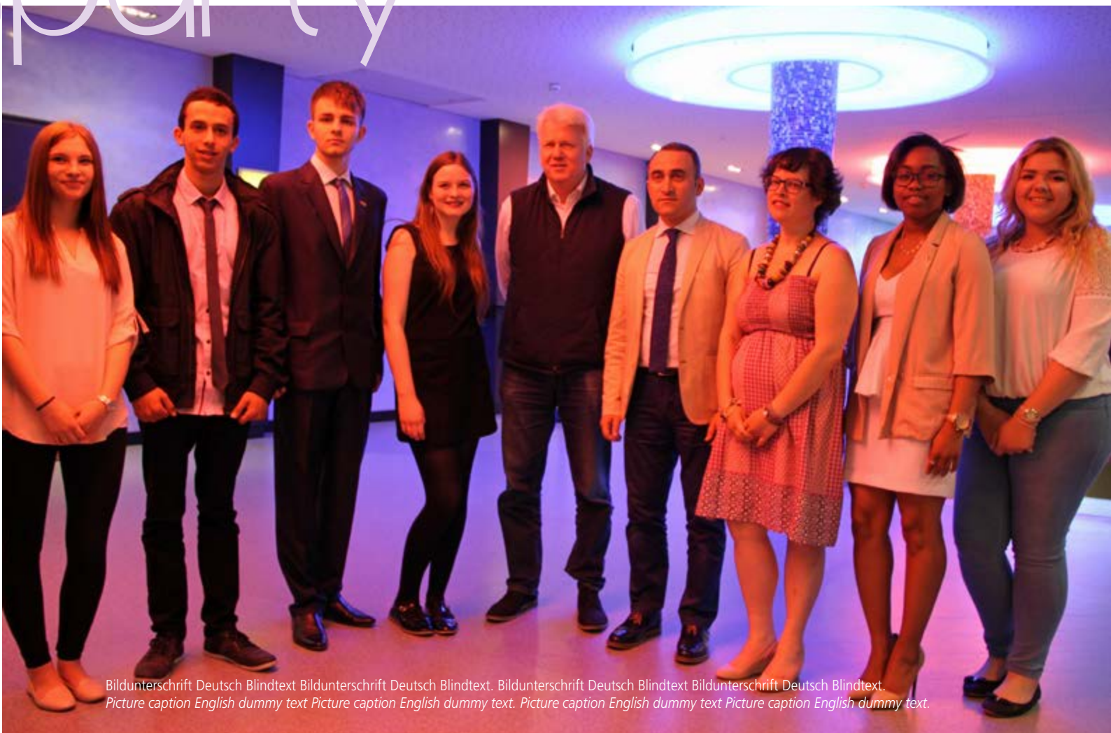
Bildunterschrift Deutsch Blindtext Bildunterschrift Deutsch Blindtext. Bildunterschrift Deutsch Blindtext Bildunterschrift Deutsch Blindtext. Picture caption English dummy text Picture caption English dummy text. Picture caption English dummy text Picture caption English dummy text.